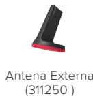
Antena Externa (311250)